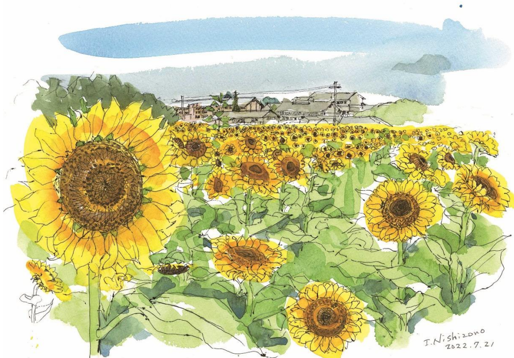
「杣之内のひまわり畑」 …向こう左側に天理中学校の校舎が見えます (水彩画／西園和泉)